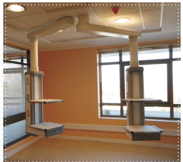
UCI - Hospital de Coquimbo (Chile)